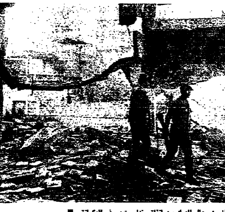
انثان من رجال الدرك بين تلفظ منزل منهم في الكوئنة

وكان العمل قد استؤنف اول امس في مصلحة تسجيل السيارات، الا ان تورق الوضع في سن القيل وسن الشراخ امس عرقل وصول الموقوفين،